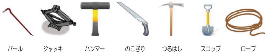
パール ジャッキ ハンマー のこぎり つるはし スコップ ロープ